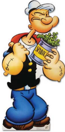
1.1 ábra: A Popeye rajzfilm 1929-ben indult. Popeye „emberfeletti” erejét a spenótnak köszönhette – a spenót vastartalmának elírását azonban sok gyermek nem köszönte meg...

Nem tudjuk biztatni. Számos dologról vagyunk szentül meggyőződve, amelyről egy nap, egy évszázad multán kiderül, hogy az előbbi példához hasonló faktoid , álismeret volt.