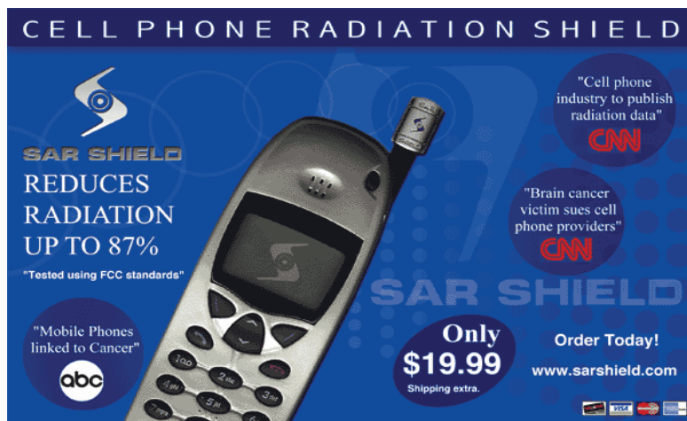
1.2 ábra: Egy a számos rivális mobiltelefonantenna-árménykolóból

Melyik orvoshoz menjek? Milyen gazdaságpolitikát támogassak a szavazatommal? Vegyek-e pi-vizet, vegyek-e mobiltelefonantenna-leárménykolót vagy mágneses ágybetétet, vegyek-e koenzim-tablettát vagy antibiotikumot? Vegyem-e meg mind? Vagy egyiket sem? Fejfájás-csillapítót ezek után mindenképp venni kell.