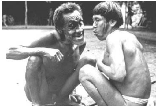
1.1b ábra Sógorok beszélgetnek

társadalomban, ahol nincsenek vagyoni és társadalmi rétegződések. A faluközösségek szociális szerveződésének alapját a rokon férfiak koalíciói képezik. Tagjai szoroson együttműködnek a vadászatban, az irtásos-égetéses növénytermesztésben és a más törzsekkel folytatott háborúkban. A csoportok az időnként fellángoló háborúk