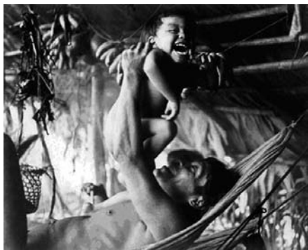
1.1a ábra Yanomamö családi idill

Napjainkban az egyik legintenzívebben kutatott népcsoport a Venezuela és Brazília határán, az Orinoco vidékén élő yanomamö indiánok (Chagnon 1979, 2000; Hames 1994, 2000). Viszonylag nagy területen elszórt falvakban élnek, amelyek lélekszáma általában 100 és 300 fő között mozog (1.1a-b ábra). Többnejű társadalom, ami azt jelenti, hogy a vezetők több feleséggel rendelkeznek.