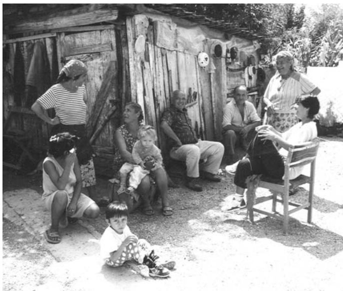
1.4 ábra A magyarországi beás cigányok szoros és bensőséges rokoni kapcsolatokat tartanak fenn

A kilencvenes évek közepén kutatásokat végeztünk Baranya megyei ormánsági falvakban, mégpedig roma és nem-roma közösségekben (Bereczkei 1993, 1998; Bereczkei–Dunbar 1997, 2002). A falusi cigány népesség vizsgálata főként Gilvánfán történt, ahol csaknem kizárólag romák laknak, a magyar etnikum tanulmányozása pedig főként Magyarmecskén folyt.