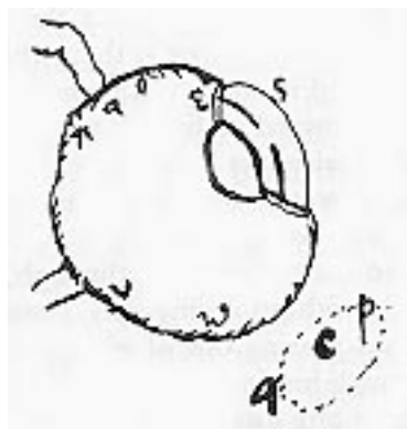
i.1. ábra Newton fiatalkori ábrája szemének mechanikus izgatásáról, amivel az alapszíneket és a nyomás-szín korrelációt vizsgálta

Hatalmát tudományos munkája alapozta meg, mert olyan nyelven tudott beszélni, amit szinte senki sem értett meg, de majd' mindenki felismerte, hogy könyveivel az egész természet megértése új alapokra helyezhető. Abszolút tér és idő, az üres térben a testek Newton törvényeit követve lépnek reakcióba a Principiáiban . Gravitációs törvénye évszázadokra tudományos világképünk alapkövévé lett. Korai írásai színelméleti témájúak voltak, és Optikája a 18. század leginkább dicsőített tudósává tették szerte Európában. Az első két kifejezést az első kötet vizsgálja kontextusában.