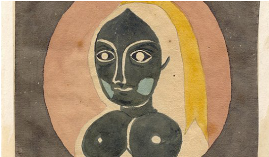
i.2. ábra Goethe évtizedekig vizsgálta az utóképek szabályszerűségeit – az eltűnő pincérnő szukcesszív kontrasztja a falon percekig jól kivehető volt

A második kötet, a Fokozódó polaritás két másik kifejezést elemez, a 'polaritást' ( Polarität ) és a 'fokozást' ( Steigerung ) ezek Johann Wolfgang von Goethe, az igazi polihisztor módszertanának kulcsai. Goethe több irodalmi korszaknak is meghatározó költőfejedelme volt, hercegi barátból Weimar titkos tanácsosává, bányaugyi miniszterévé előléptetett középosztálybeli, aki fiatalon tivornyázott, szoknyák után kajtatott, időskorára pedig valódi udvartartás felett rendelkezett és Jupiter-szemei egy-egy vilanásával irányította hódolói körét. Művei mindmáig kötelező olvasmányok, barátai, követői és levelezőtársai révén a Romantika korában létrehozta a világirodalmat, mint a nemzeti nyelvek fölé magasodó, azok formálódását meghatározó képződményt. Költő volt, világhírű Fauszt jának II. részét már az ablakban állva, a kertjét nézegetve diktálta: polírozott sorai egyre növekvő természetességgel folytak ki belőle. Sok ezer oldalas irodalmi életműve még így is épp csak összemérhető a szemlélődéssel (ásványok, növények, csontok, metszetek) és természettudományok kutatásával töltött idővel életében. 40 évig foglalkozott színtannal, erre volt életében a legbüszkébb, és ezt szégyellte századokig a legjobban az életművében legtöbb tudós hódolója.