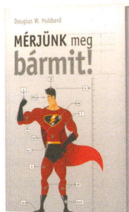
Douglas W. Hubbard: Mérjünk meg bármit! Akadémiai Kiadó, Budapest, 2011

A szerző láthatóan igyekszik a lehető legkevesebb matematikai képletet papírra vetve (teljesen azért nem sikerül ezeket elkerülni) megmutatni, hogyan lehet a minket körül vevő világot mérhető és ezáltal megszelídíthető egységekre bontani, mindezt azért, hogy az eredményekből azután olyan következtetéseket vonjunk le, amivel hatékonyabbá tehető cégünk irányítása. Bátran ajánlható mindenkinek, aki – szereti vagy nem szereti – számokkal kell dolgozzon, a hr-vezetőktől a kontrollereken át egészen a marketingesekig. – SzP